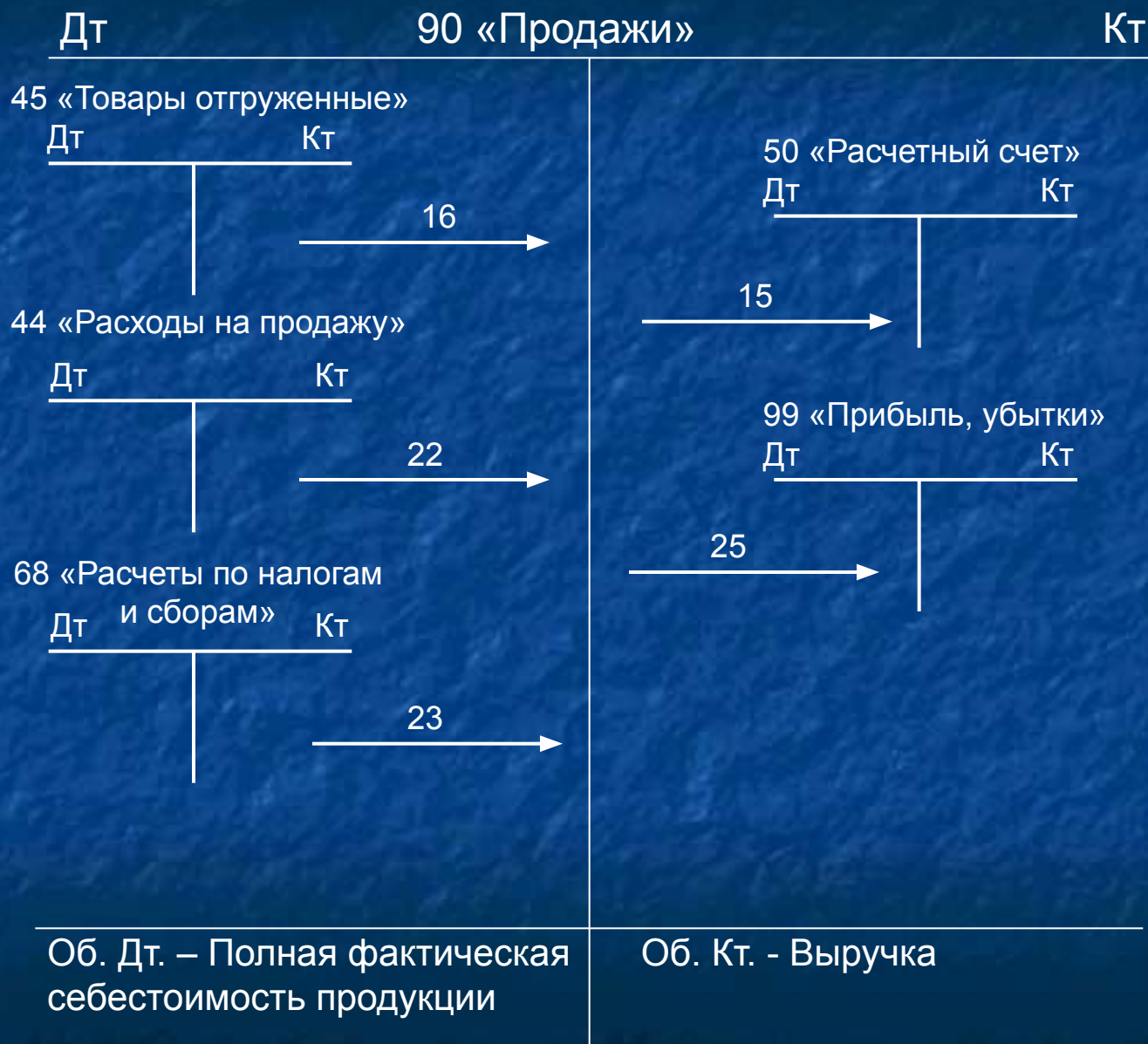
Схема учета процесса реализации