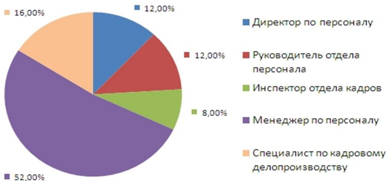
Распределение ключевых специалистов сферы "Кадровые службы, HR"