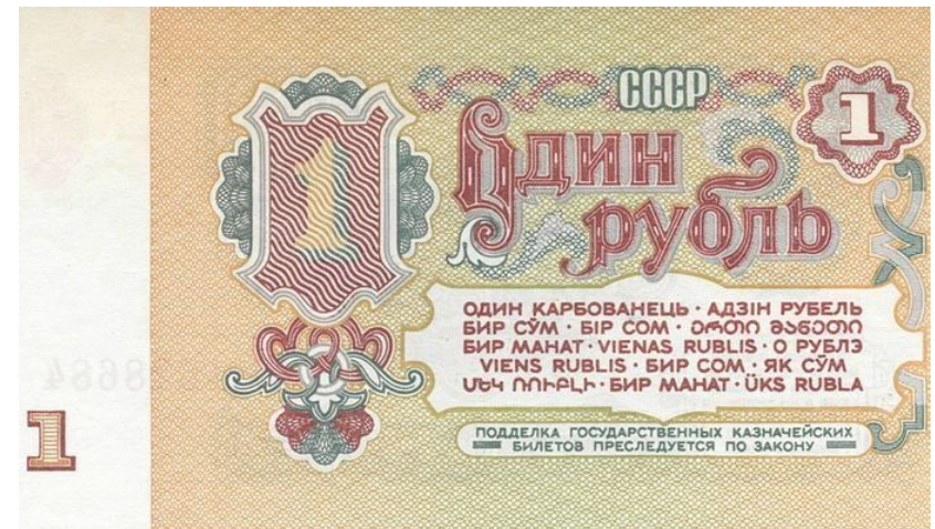
Единая денежная единица СССР