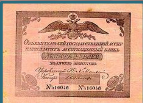
Ассигнация 1802 г

Появление ассигнационных рублей было вызвано большими расходами правительства на военные нужды, приведшими к нехватке серебра в казне (все расчёты, велись исключительно в серебряных и золотых монетах).