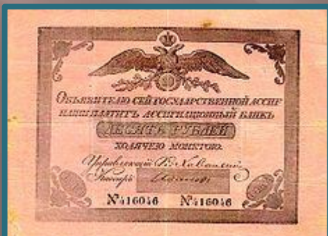
Ассигнация 1802 г

Появление ассигнационных рублей было вызвано большими расходами правительства на военные нужды, приведшими к нехватке серебра в казне (все расчёты, велись исключительно в серебряных и золотых монетах).