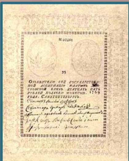
25 рублей 1769 г