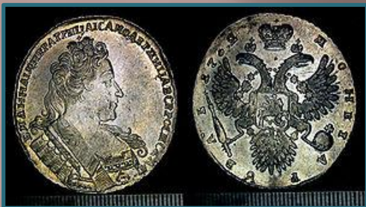
Серебряный рубль Анны Иоанновны, 1732 год

С 1769-го года в Российской империи, серебряный рубль перестает быть основной денежной единицей, уступая своё место ассигнационному рублю, реализованному в виде серии бумажных (денег) ассигнаций, которые разменивались на медную монету.