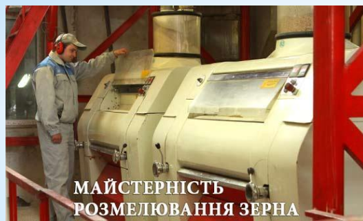
МАЙСТЕРНІСТЬ РОЗМЕЛЮВАННЯ ЗЕРНА