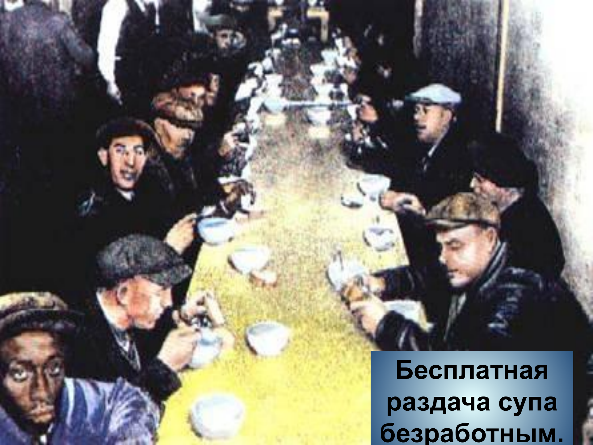
Бесплатная раздача супа безработным.