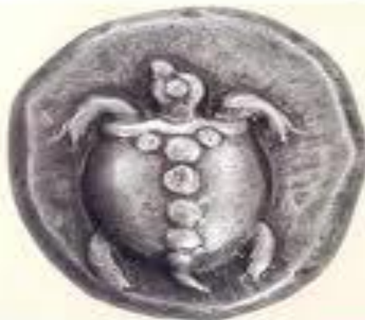
Статер Згнна, 480-е гг. до н.э. Серебро, диаметр 24 мм, вес 19 гр.