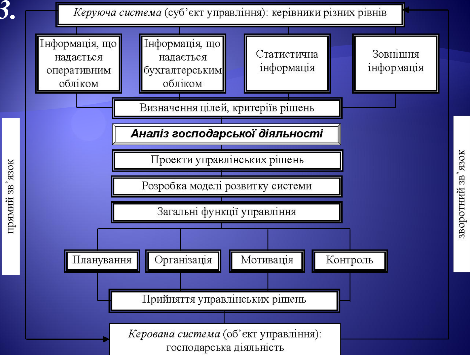
Рис. 3. Місце аналізу господарської діяльності в управлінні