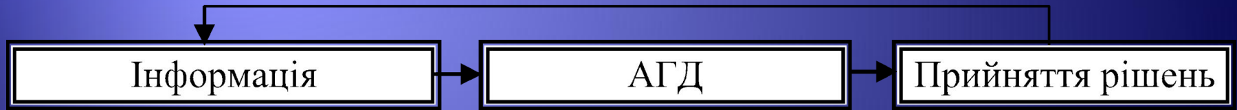
Рис. 4. Місце АГД в процесі прийняття управлінських рішень

АГД займає проміжне місце, виступаючи як зв'язкова ланка між інформаційним етапом і етапом прийняття рішень, тим самим впливаючи на якість прийнятих управлінських рішень.