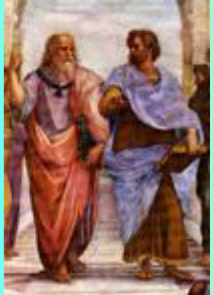
Платон и Аристотель

После смерти Платона Аристотель выходит из Академии и меняет место жительства - переселяется в город Атарней.