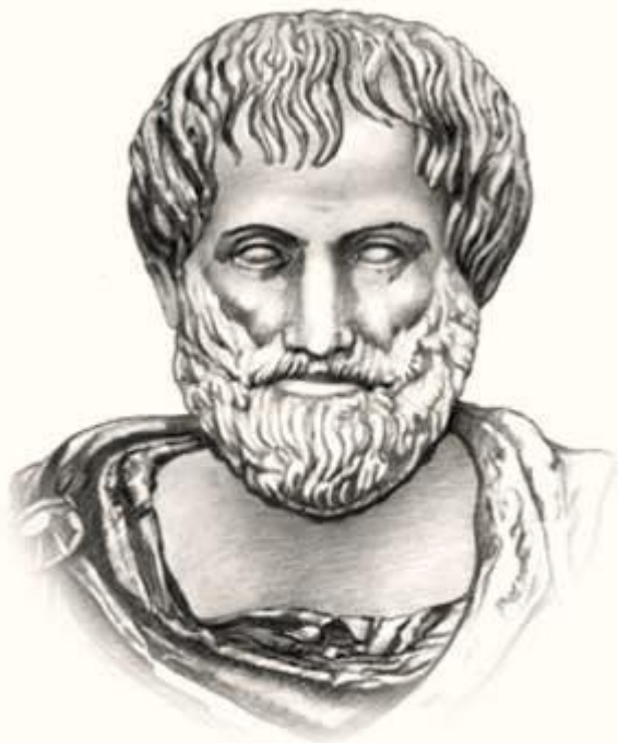
АРИСТОТЕЛЬ 384-322 до н. э.