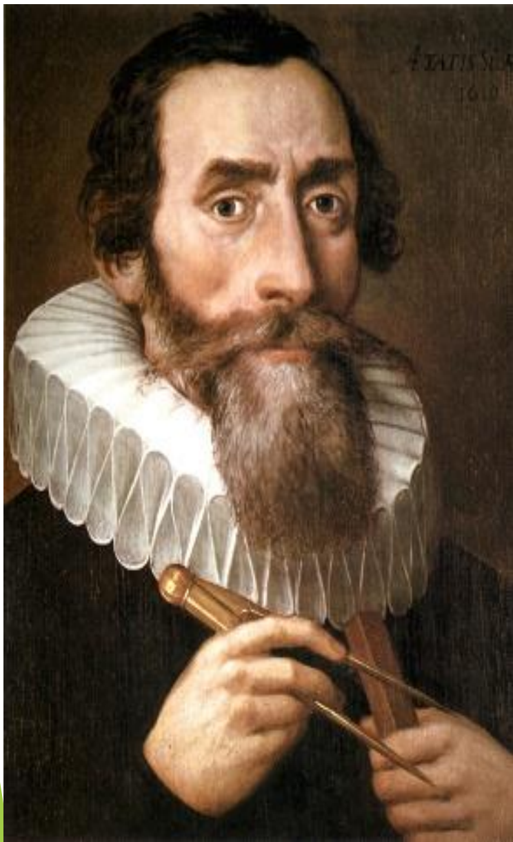
Кеплер Иоганн 1571-1630

Кеплер Иоганн ( нем. Johannes Kepler 27.12. 1571, Германия, Вюртемберг, Вейль-дер-Штадт қ. — 15.11.1630, Бавария, Регенсбург қ.) - Неміс астрономы, математигі. XVII ғ. адамзаттық ғылым-техника төңкерісінің дәуір бөлгіш тұлғаларының бірі. Әйгілі астроном Тихо Брагенін қол астында зерттеумен айналысқан шәкірті. Тихо Браге көптеген астрономиялық құбылыстарды көзеткенімен оларға синтез жасай алмады. Ал Кеплер болса оларды қорытып, анализдеп, әйгілі заңдарды туғызды. Кеплер заңдарын ашты. Кейінгілер оның "жаңа астрономия", "Әлемнің гармониясы", Коперниг астрономиясы туралы" кітаптары арқылы планеталар қозғалысының үш заңын тұрақтандырды. Ол өзінен кейінгі Ньютон секілді ғалымдардың тартылыс заңын ашуына тікелей ықпал етті. Иоганн Кеплер 1593 ж. Тюбинген университетін бітіреді. Кеплер балалық шағында куәгер болған 1577 жыл Ұлы Кометасы күллі Еуропа астрономдарының назарын аударды.