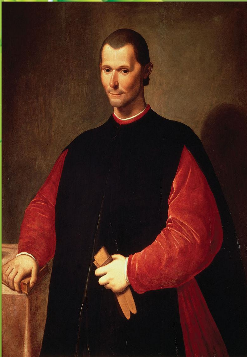
Макиавелли Никколо 1469 – 1527

Макиавелли Никколо (итал. Niccolò di Bernardo dei Machiavelli; 3 мамыр 1469 жыл, Флоренция — 21 маусым 1527 жыл, сонда) — италиялық философ, жазушы, саясаткер-флоренциялық дипломат, саяси теоретик, саяси биліктің жаңа тарихтағы алғашқы аналитигі.