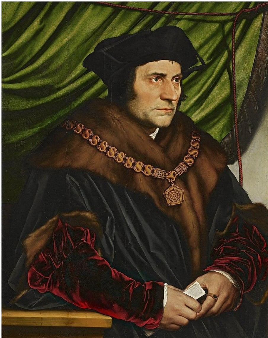
Мор Томас 1478-1535

Мор Томас (ағылш. Sir Thomas More, тағы ағылш. Saint Thomas More; 7 ақпан 1478, Лондон — 6 шілде 1535, Лондон)) – ағылшын гуманисі, утопиялық социализмнің негізін салушылардың бірі. 1529 – 1532 жылы Англияда мемлекеттік жоғары қызметте болды. Папаны жақтап, корольге қарсы болғаны үшін Мор корольдің бұйрығы бойынша дарға асылды. Мор көптеген моральдық-философиялық трактаттар қалдырған. Өзінің “Утопия” (1516) деген негізгі шығармасында жеке меншікке негізделген қоғамды, өз тұсындағы әлеуметтік-саяси қатынастарды сынға алып, қоғамдық меншікке негізделген қоғамдық құрылысты суреттеді. Қоғамдағы кемшіліктердің негізі жеке меншікте, ал оның өмір сүру негізі – адамдардың теріс әрекеті, менмендік, мансапқорлық дейді.