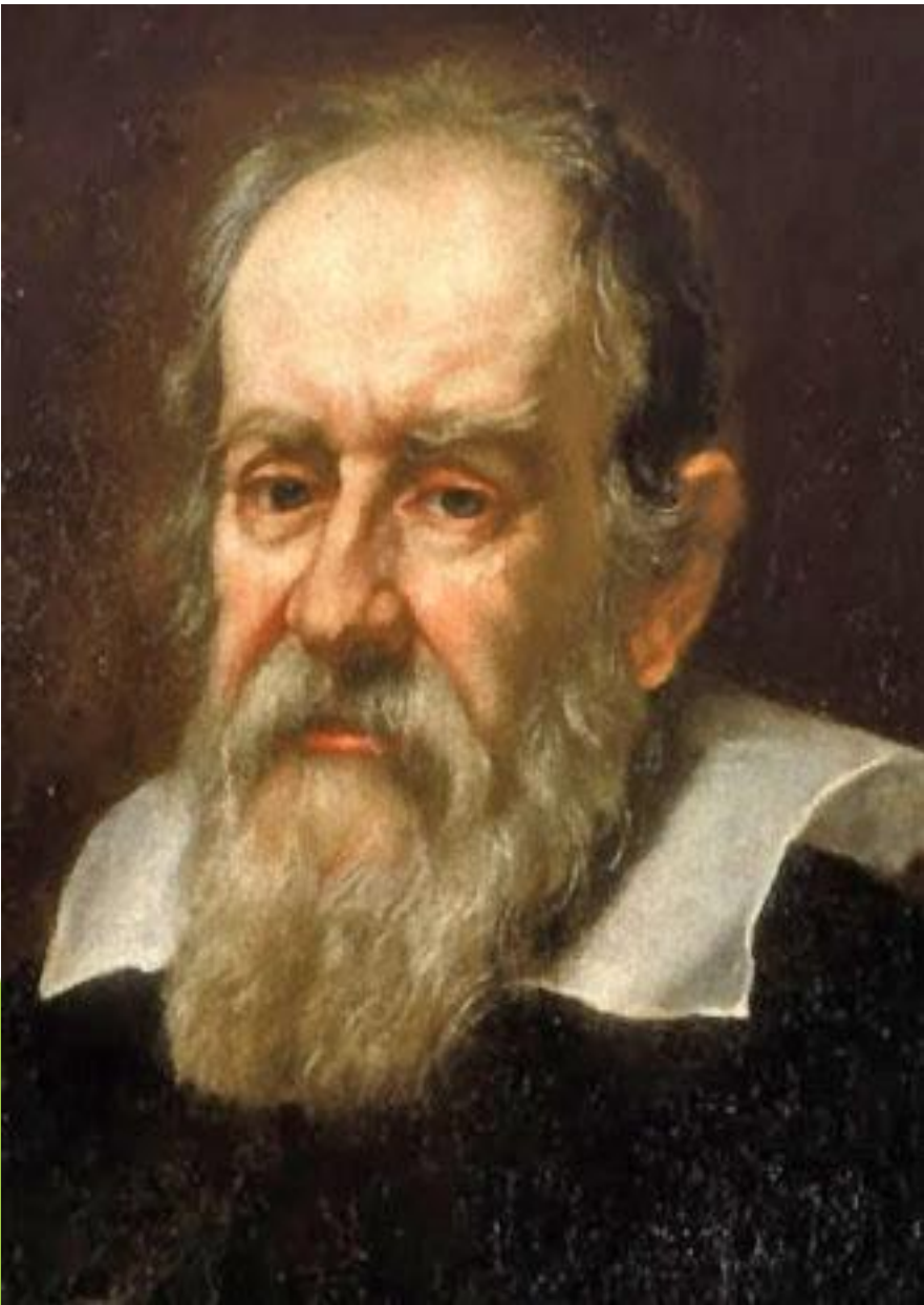
Галилео Галилей 1564-1642

Галилео Галилей (итал. Galileo di Vincenzo Bonaiuti de' Galilei; 15 ақпан 1564, Пиза — 8 қаңтар 1642, Арчетри, Флоренция маңы) — итальян философы, математик, физик, механик және астроном, табиғаттану ғылымдарының негізін салушы, өз заманындағы ғылымға өте қатты әсер еткен. Ол ұлы ғалым болумен бірге, музыкант, суретші, ақын, әдебиетші де болған.