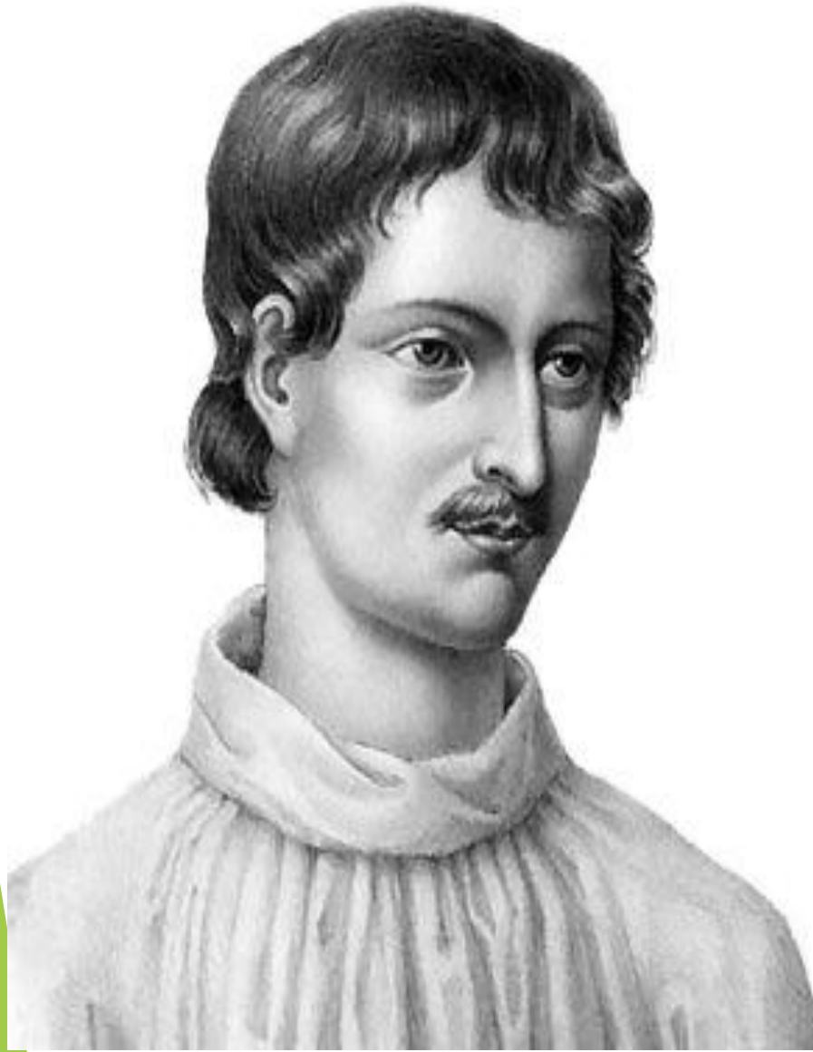
Джордано Филиппо Бруно

Джордано Филиппо Бруно (1548, Италия, Нола — 17 ақпан, 1600, Рим) — италиялық философ, ақын, астроном, пантеизм өкілі