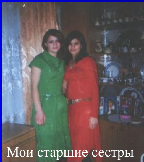
Мои старшие сестры

Все мне отвечали по-разному, но встречались и очень похожие трактовки понимания слова «счастье».