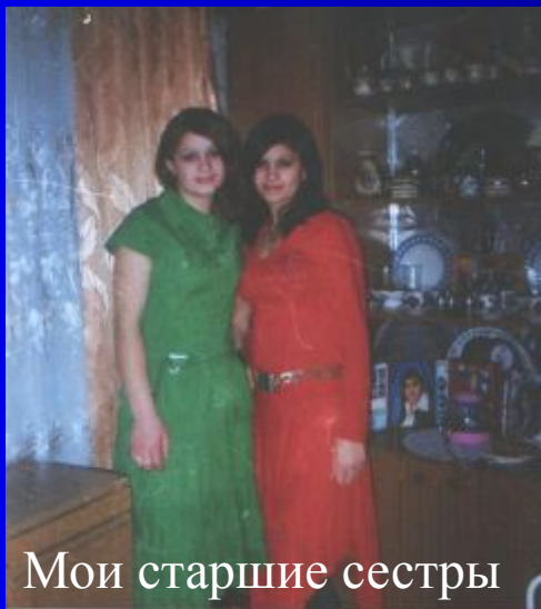
Мои старшие сестры

Все мне отвечали по-разному, но встречались и очень похожие трактовки понимания слова «счастье».