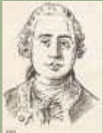
Юм Давид (1711-1776)

ПОЗИТИВИЗМ (лат. positivus — положительный) — философское направление, отрицающее познавательную и практическую ценность традиционной философии и признающее единственным источником подлинного «позитивного.» знания только специальные науки, опирающиеся на эмпирический опыт. Его предшественниками считают Д. Юма, Ж- Даламбера и К. Сен-Симона, О. Конт и Дж. С. Милль и Г. Спенсер.