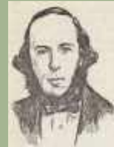
Спенсер Герберт (1820-1903)

НЕОПОЗИТИВИЗМ — совокупность философских течений, сложившихся в общем русле позитивистской традиции в 20—60-х годах XX в. и составивших содержание третьего этапа его развития.