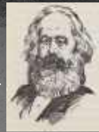
Маркс Карл Генрих (1818-1883)

МАРКСИЗМ — совокупность философских, экономических и социально-политических концепций, разработанных К. Марксом и Ф. Энгельсом и объединенных общей идеей коммунизма.