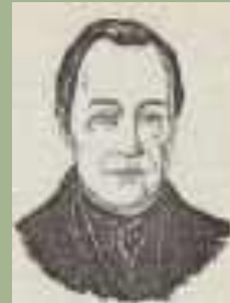
Конт Огюст (1798-1857)