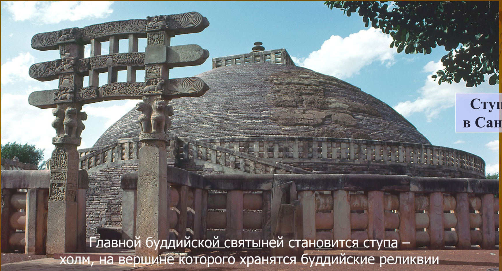
Ступа в Санчи

Главной буддийской святыней становится ступа – холм, на вершине которого хранятся буддийские реликвии