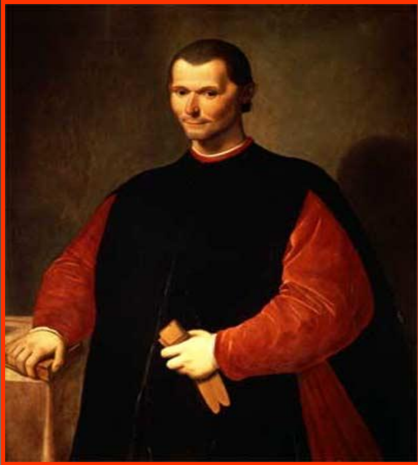
Никколо Макиавелли философ, политик, писатель (1469-1527) Флоренция

С течением времени образ Макиавелли стал одним из символов в истории европейской и мировой культуры и в качестве такого неизбежного должен вызывать к жизни все новые научные и художественные интерпретации. Кроме того, современным мыслителем делают Макиавелли беспощадная острота и масштабность общечеловеческих противоречий, сталкивающихся в его творчестве. Предметом этой работы является обзор творчества и деятельности Макиавелли на основании его этики - подразумевается этика в широком смысле - не столько положительные или отрицательные предписания, сколько представления о мотивах поступков людей, об отношениях ценности, на которых строится общественная механика.