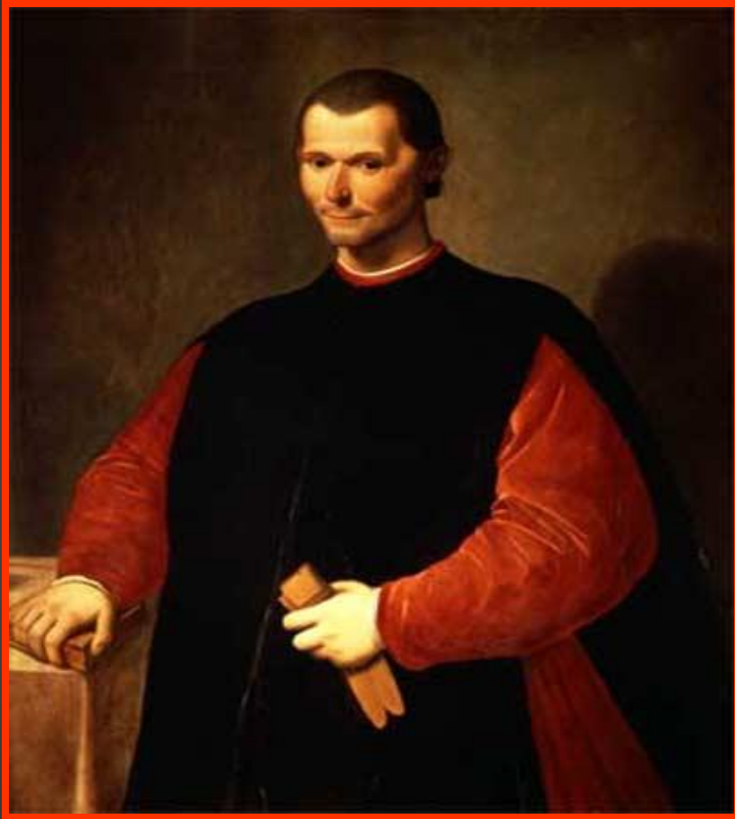
Никколо Макиавелли философ, политик, писатель (1469-1527) Флоренция

С течением времени образ Макиавелли стал одним из символов в истории европейской и мировой культуры и в качестве такого неизбежного должен вызывать к жизни все новые научные и художественные интерпретации. Кроме того, современным мыслителем делают Макиавелли беспощадная острота и масштабность общечеловеческих противоречий, сталкивающихся в его творчестве.