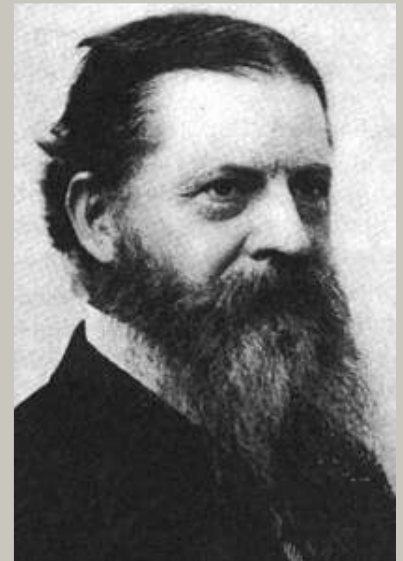
Charles Sanders Peirce