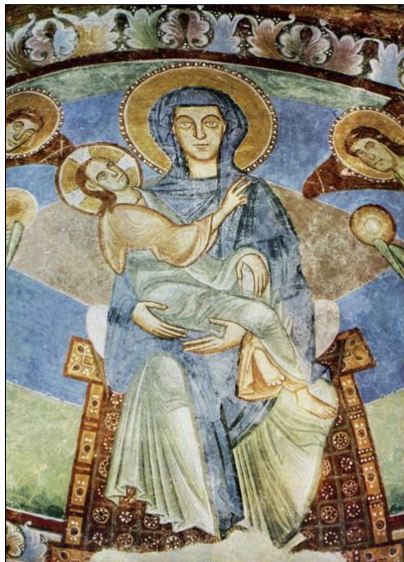
Мадонна и младенец с ангелами и святыми (фрагмент). Южно- тирольский стиль. Поздний 12 век.