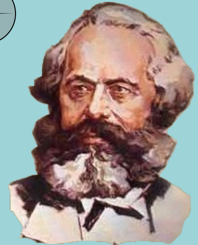
К. Маркс. «К критике политической экономики».

На известной ступени своего развития материальные производительные силы общества приходят в противоречие с существующими производственными отношениями, или — что является только юридическим выражением последних — с отношениями собственности, внутри которых они до сих пор развивались. Из форм развития производительных сил эти отношения превращаются в их оковы. Тогда наступает эпоха социальной революции. С изменением экономической основы более или менее быстро происходит переворот во всей громадной надстройке.