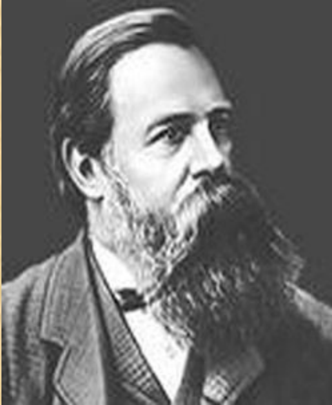
Фридрих Энгельс (1820-1895 )