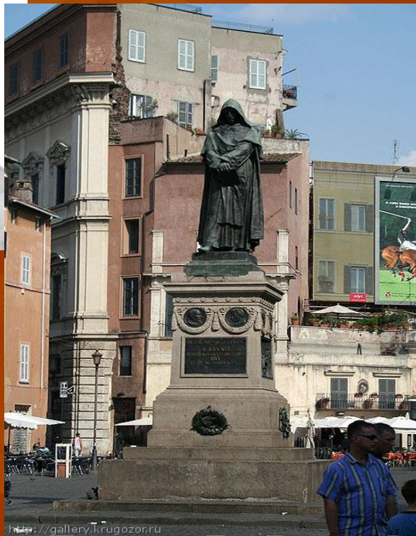
Памятник Дж. Бруно в Риме

Д.Бруно - сторонник учения Коперника, утверждал, что наша Вселенная бесконечна, не имеет центра, состоит из множества галактик. Согласно Бруно не существует Бога, отдельно от Вселенной, Вселенная и Бог – одно целое (Пантеизм).