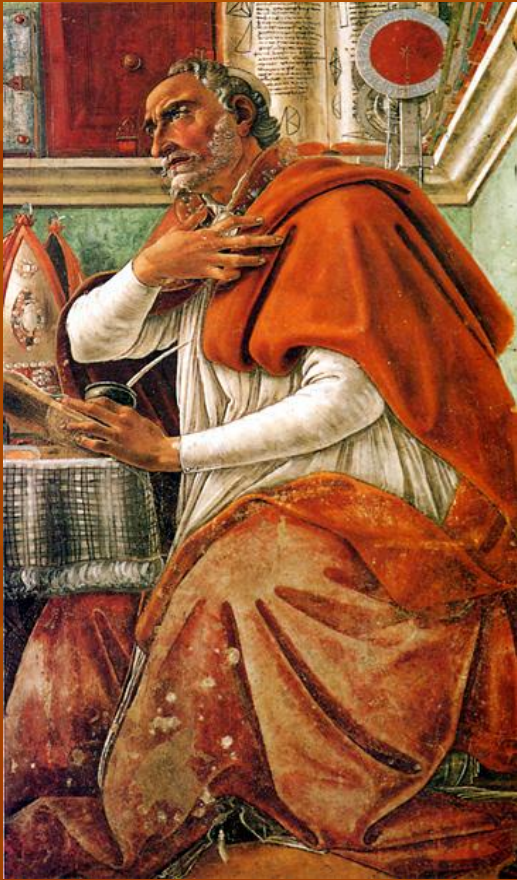
Августин Аврелий (354-430гг.)

Августин Аврелий - один из наиболее ярких мыслителей периода патристики, автор многих работ, в том числе и знаменитой «Исповеди».