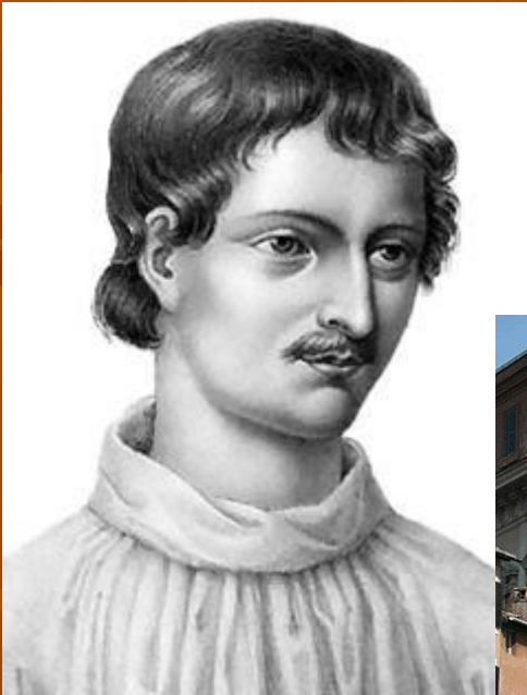
Джордано Бруно (1548-1600)