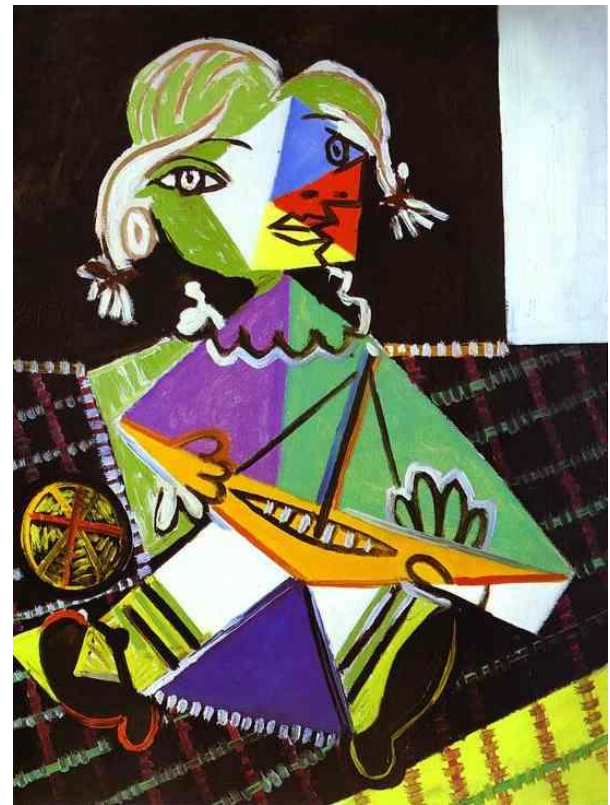
Пабло Пикассо «Девочка с лодочкой»