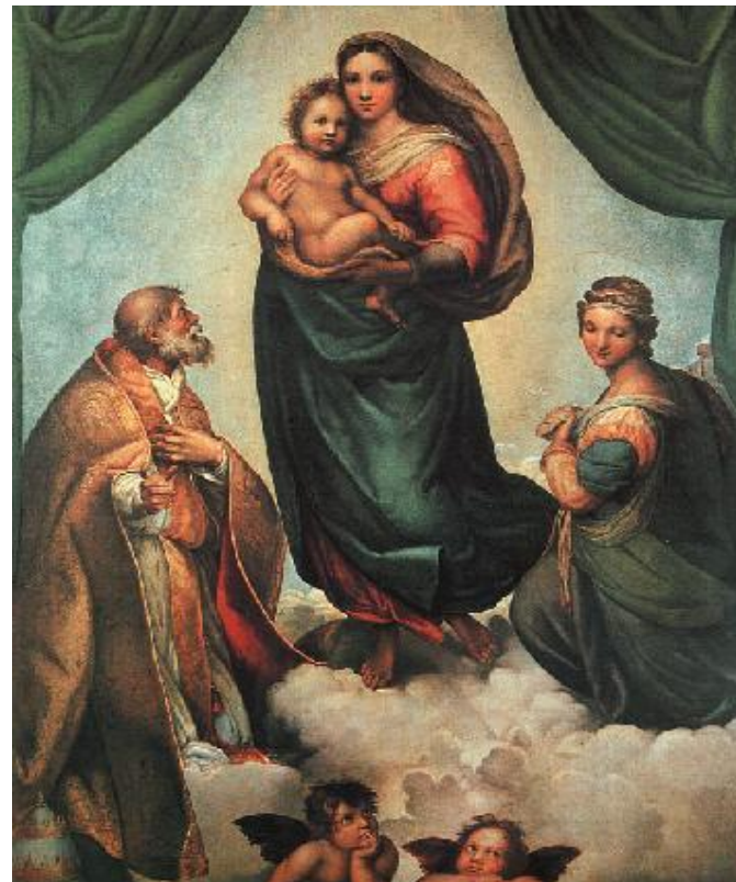
Рафаэль Санти «Сикстинская мадонна»