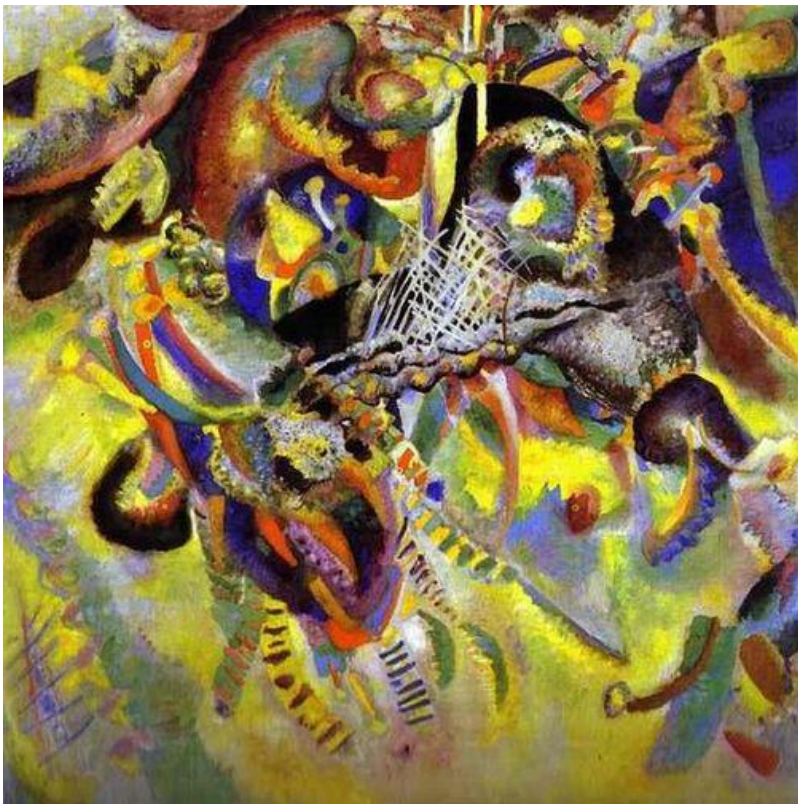
Кандинский «Апофеоз абстракции»