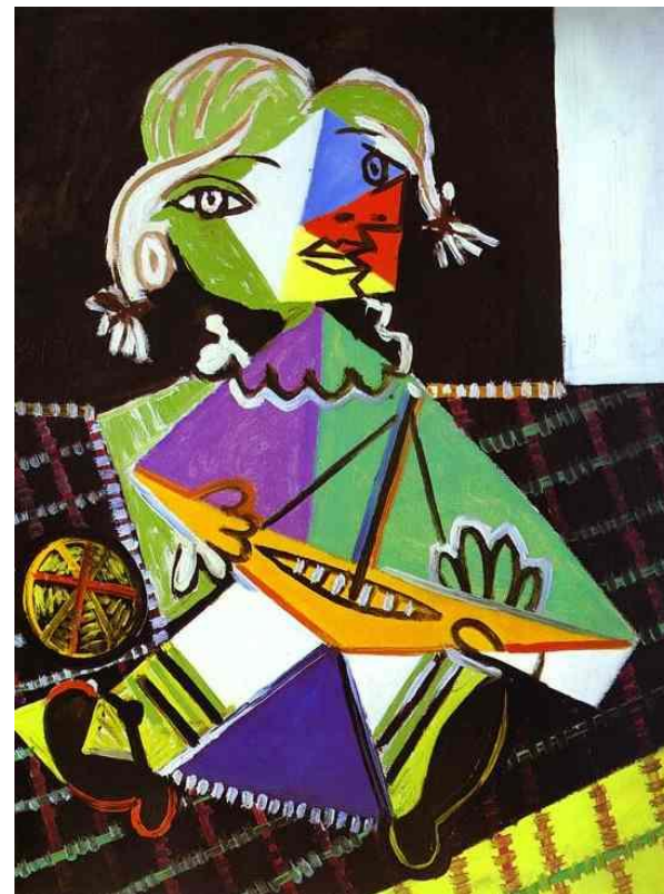
Пабло Пикассо «Девочка с лодочкой»