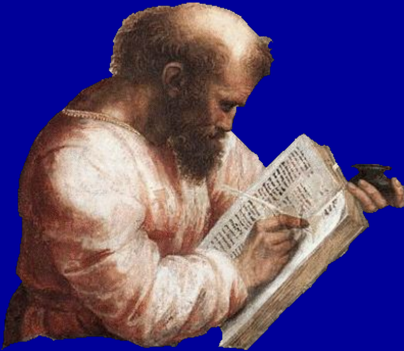
Пифагор (VI в. до н.э.)