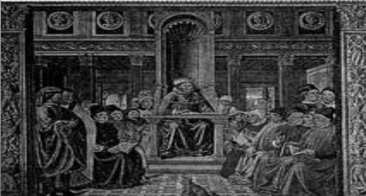
АВРЕЛИЙ АВГУСТИН (354—430)

«О жизни блаженной» (386), «О порядке» (386), «Монологи» (387), «О количестве души» (388 – 389), «Об учителе» (388 – 389), «О бессмертии души» (387), «Об истинной религии» (390), «О свободной воле» (388 – 395) и др.