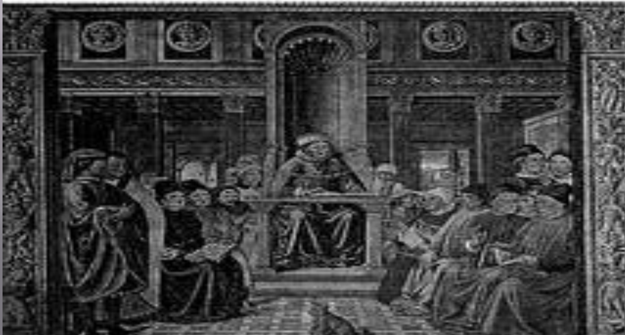
АВРЕЛИЙ АВГУСТИН (354—430)

«О жизни блаженной» (386), «О порядке» (386), «Монологи» (387), «О количестве души» (388 – 389), «Об учителе» (388 – 389), «О бессмертии души» (387), «Об истинной религии» (390), «О свободной воле» (388 – 395) и др.