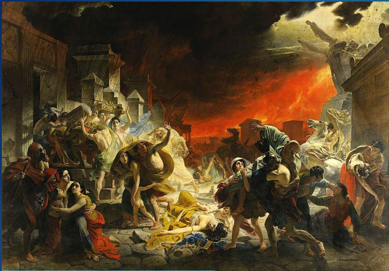
К. П. Брюллов Последний день Помпеи