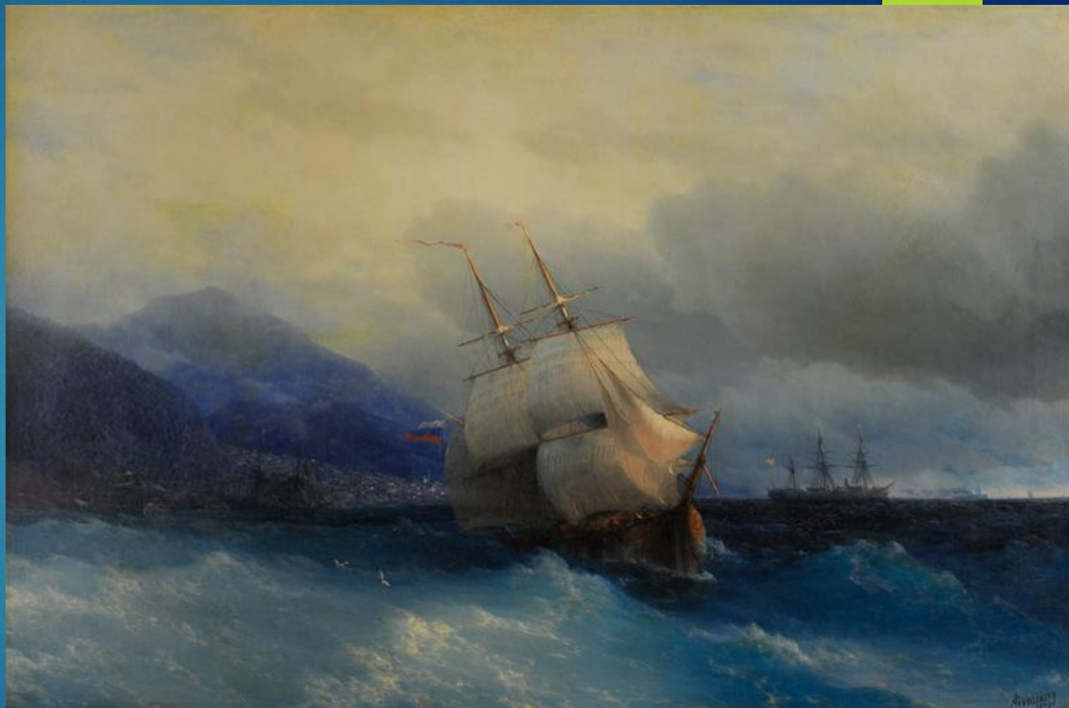
Айвазовский И.К. Трапезунд с моря. 1875.