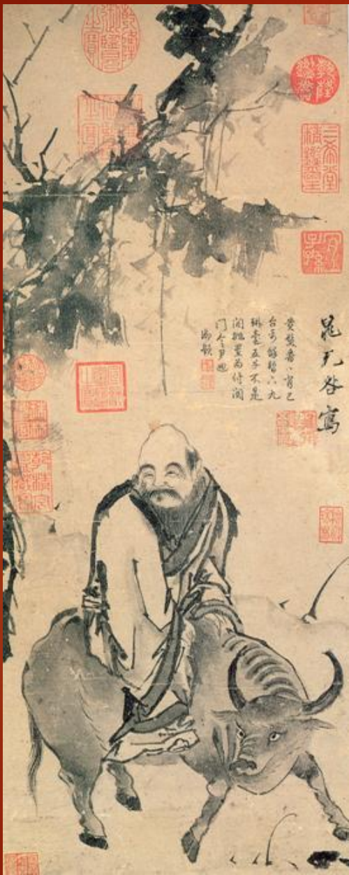
Чжао Бучжи Портрет Лао Цзы, едущего верхом на быке Рубеж XI – XII вв.