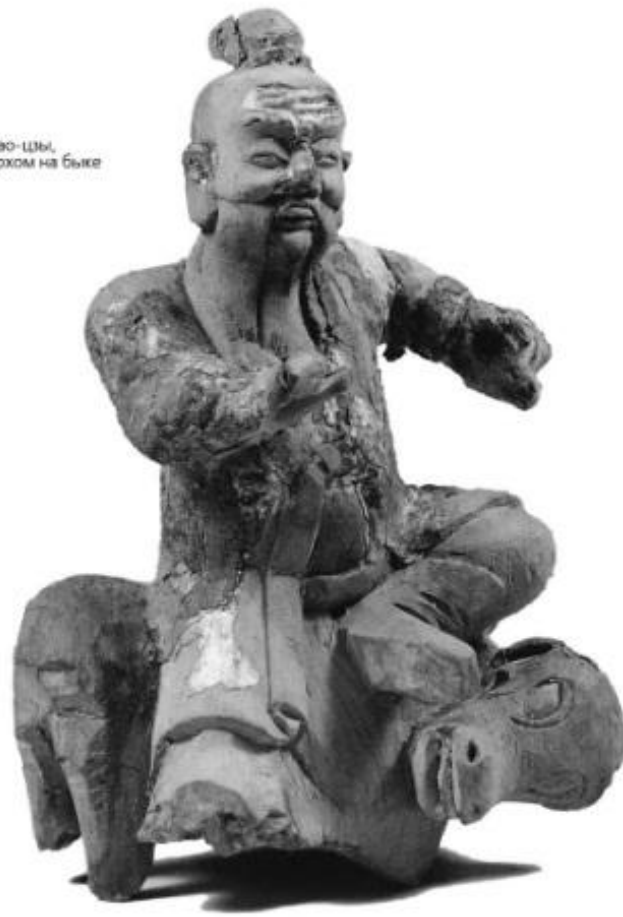
Статуэтка Лао-цзы, едущего верхом на быке Терракота. Тайвань. XIX в.