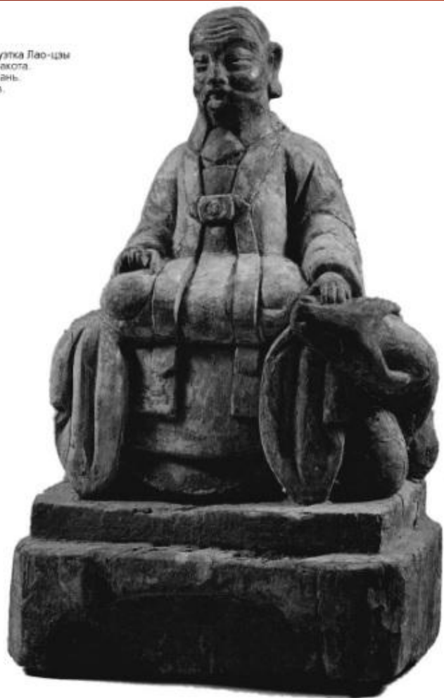
Статуэтка Лао-цзы Терракота Тайвань. XIX в.