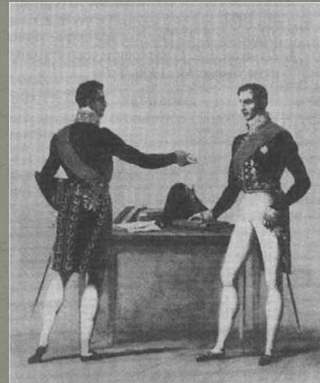
Мундиры профессорско-преподавательского состава Санкт-Петербургского университета и мундиры академиков образца 1834 г.