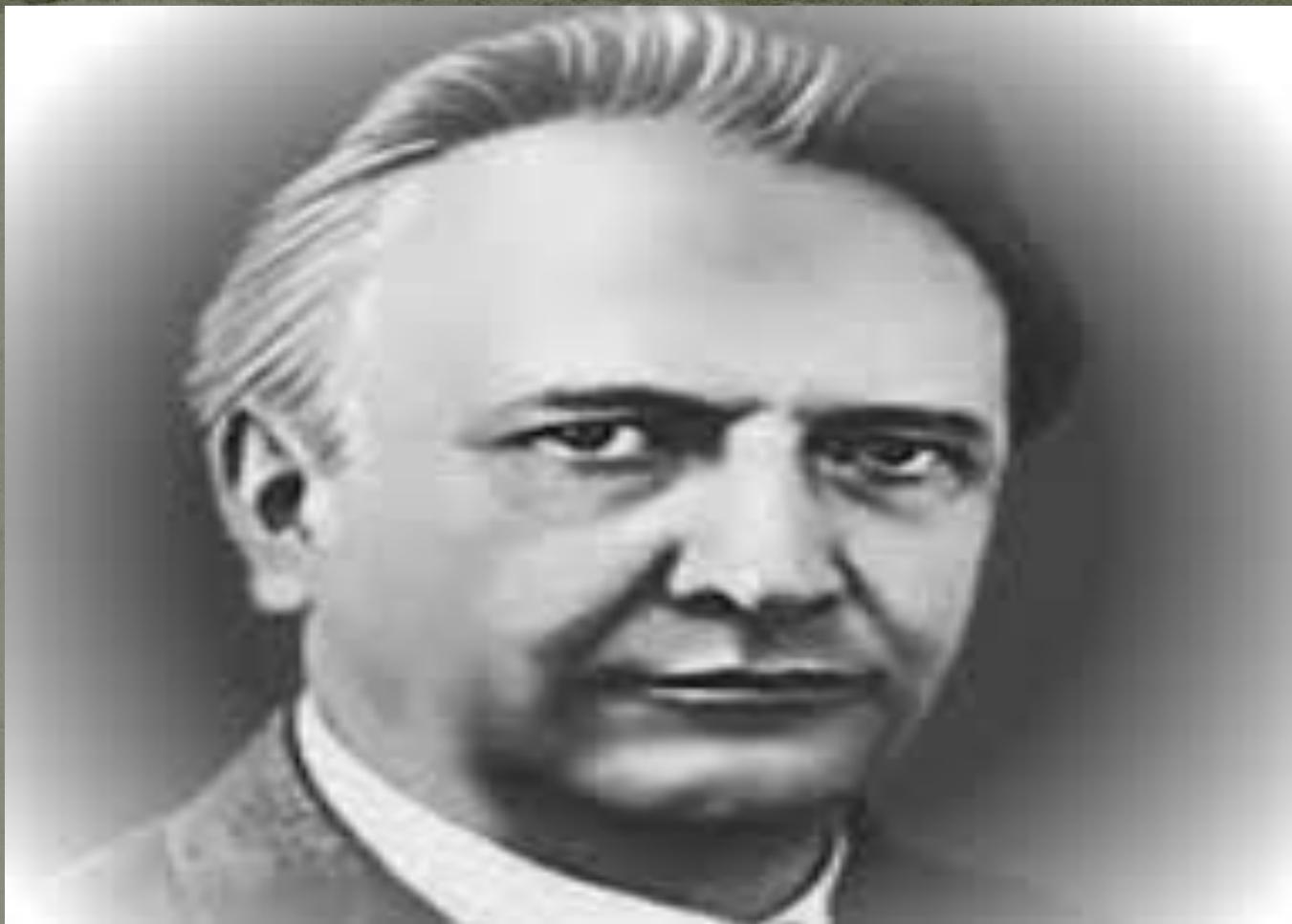
КАРЛ ТЕОДОР ЯСПЕРС (1883-1969)