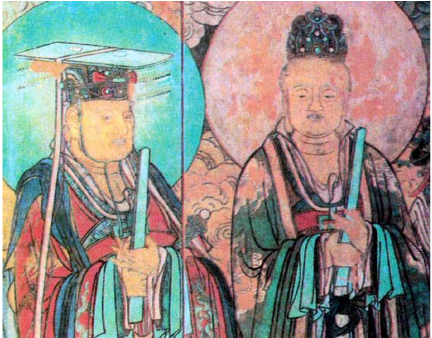
Портрет Лао-цзы (справа). Фреска. 1260-1368 гг.