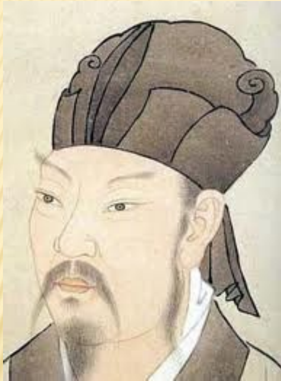
Хань Юй. 韩愈 (768—824)

Конфуцианство как этико-политическая и религиозная система проникло во все поры общественной жизни и в течение многих веков определяло нормы морали, семейные и общественные традиции, научную и философскую мысль, препятствуя их дальнейшему развитию и выработав определённые стереотипы в сознании народа, в особенности среди интеллигенции. Конфуцианство ещё больше укрепилось после острой борьбы с буддизмом в 7-8 вв. Большая роль в этом принадлежала известному писателю и мыслителю Хань Юю (768-824), выступившему с резкой критикой буддизма и в защиту конфуцианства.