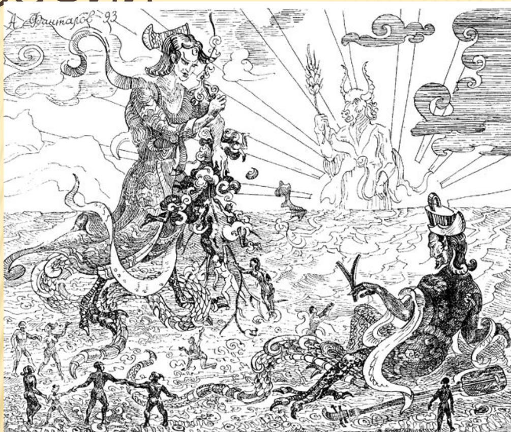
Добрые боги Китая (А. Н. Фанталов, рисунок тушью).

В Китае подобно Индии возникновение философии предшествовало возникновению рабовладельческого строя. Однако, если в Индии главное внимание сосредоточено на внутреннем мире человека, то в Китае на передний план выходят политические проблемы. Это обосновывается происходившими в то время массовыми выступлениями низов населения и кровопролитными войнами.