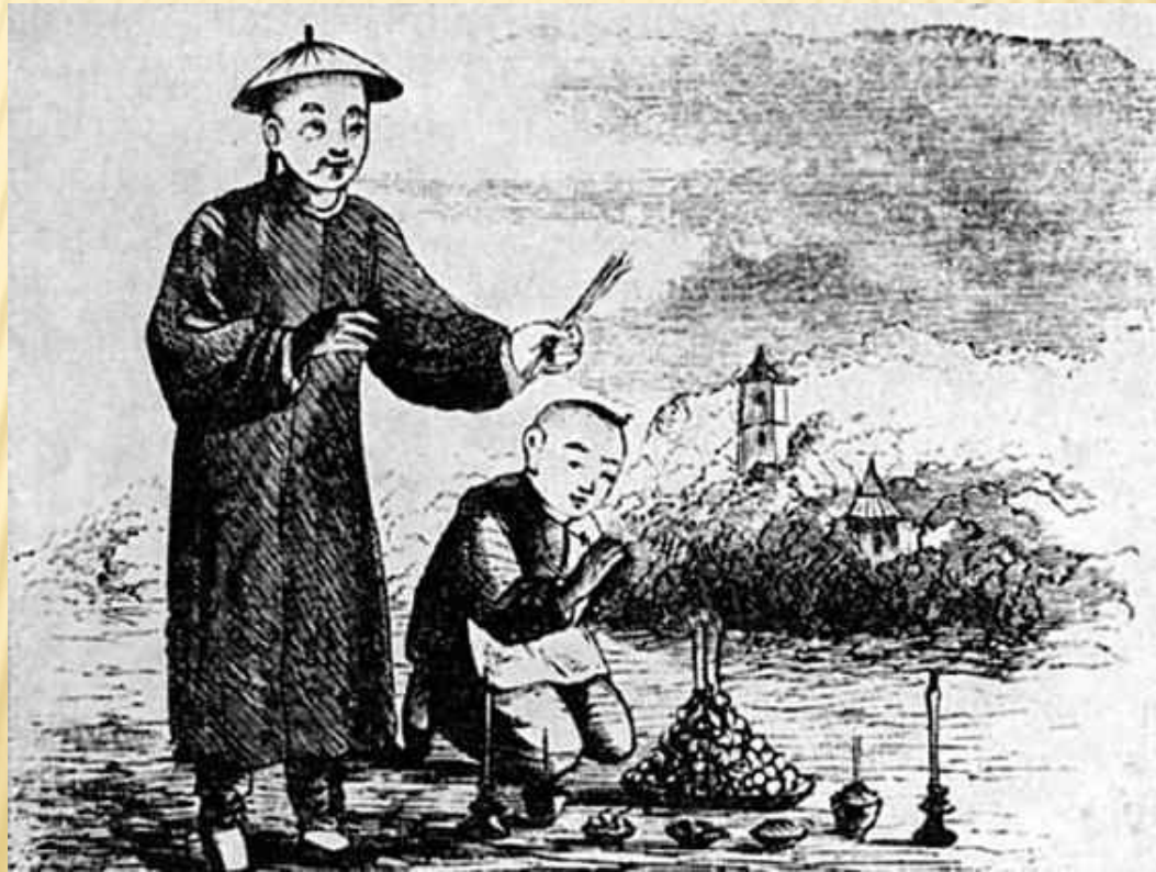
Молодой Конфуций приносит жертву

Исходным пунктом учения Конфуция является достижение гармонии между нравственным совершенствованием человека и его деятельностью. Такая гармония, по его мнению, - залог построения идеального общества и государства. Социальным идеалом послужил золотой век в истории Китая, правление мифических императоров Яо, Шунь и Юй. За прошедшее время общество Китая деградировало, что выразилось в многочисленных конфликтах. Исходя из этого конфуцианство предлагает принцип «выпрямления имен» (возвращение прежнего смысла словам и понятиям), который будет предпосылкой восстановления прежних норм.