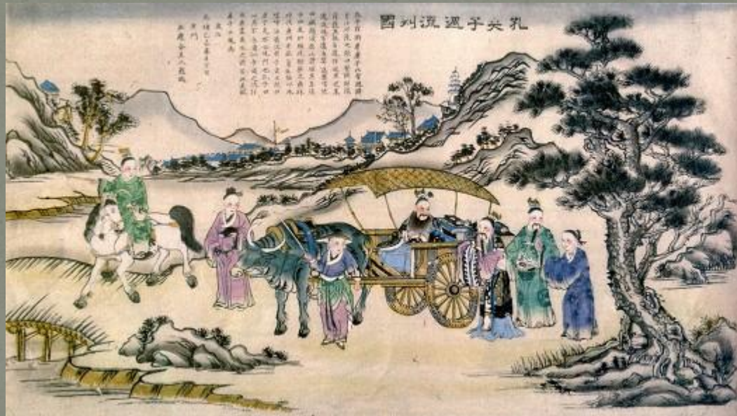
Конфуций покидает царство Вэй с учениками

В условиях тяжелой ситуации в государстве, Конфуций отказывается от своей службы. К тому времени у него уже были ученики. С ними он отправился странствовать по Китаю. Его целью было донесение до правителей разных земель идеалов правления, моральных норм.