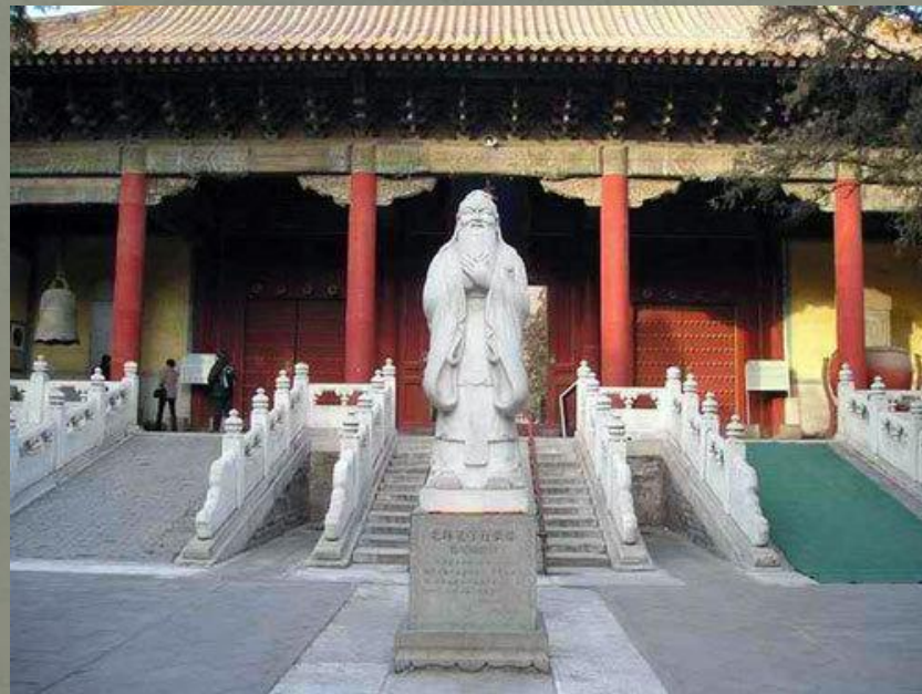
Храм, дворец и роща Конфуция в Цюйфу, провинция Шаньдун

Дата рождения философа – около 551 года до нашей эры. Происходил из знатного, но обедневшего рода. Отец был военным, а мать Кун Цю – юная наложница, которая, опасаясь гнева и зависти старших жен, покинула дом после смерти мужа. Молодая мать забрала сына и отправилась в Цюйфу, к себе на родину.