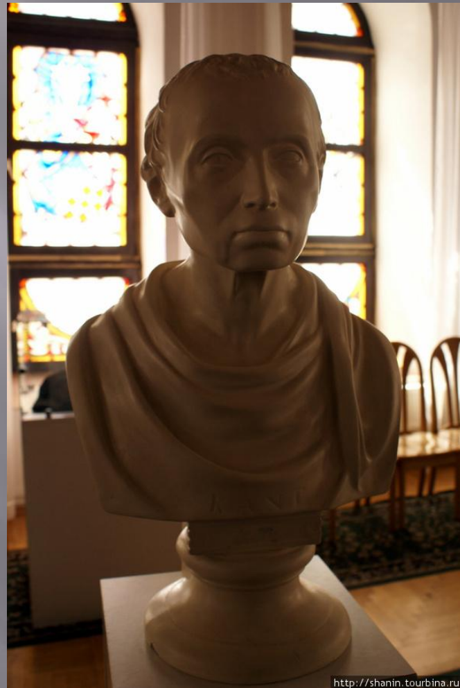
Бюст Иммануила Канта в музее собора Кёнигсберга