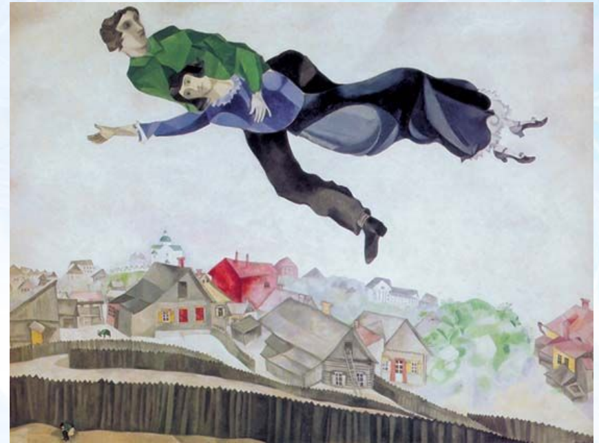
Марк Шагал. Над городом.