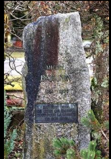
Могила Бакунина в Берне

Умер Михаил Александрович Бакунин 1 июля (19 июня) 1876 года в Берне, в Швейцарии, в больнице для чернорабочих, куда он был помещён по его настоянию.