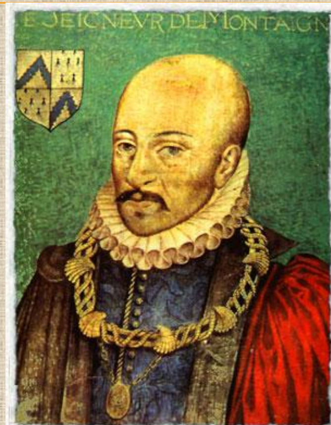
Мишель де Монтень (1533-1592)