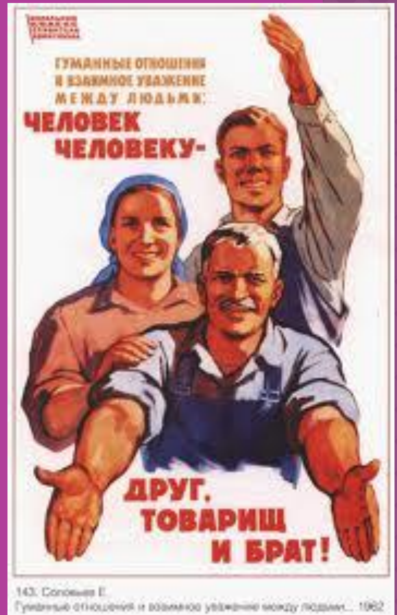
143. Соловьев И. Гуманные отношения и взаимное уважение между людьми... 1962

Требования морали направлены ко всем людям