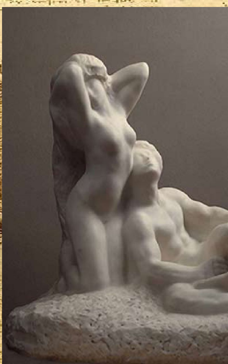
О.Роден Поэт и муза

Культуре в равной мере нужны наука и искусство. Для того чтобы наука приносила людям пользу и радость, а не вред и горе, она должна быть тесно связана с искусством.