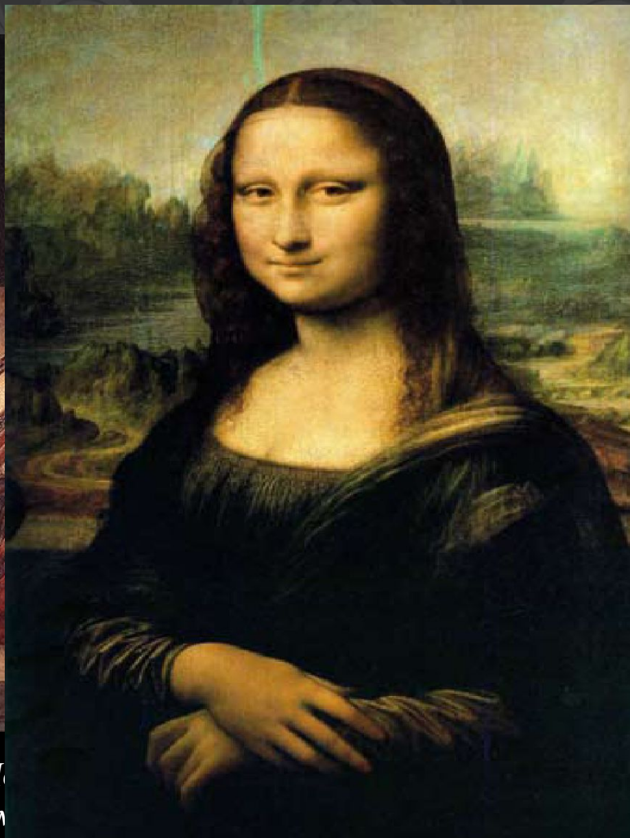
Л. да Винчи. Джоконда