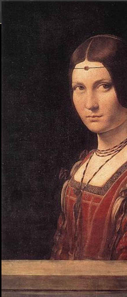
Л. да Винчи П незнаком

Портреты кисти Леонардо да Винчи — это образы свободных духом, добродетельных и талантливых людей