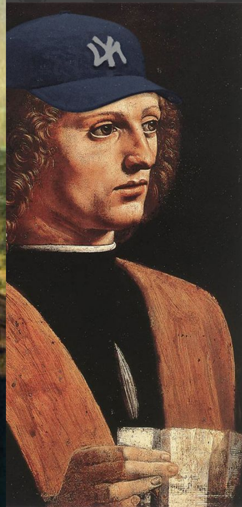
Л. да Винчи Портрет музыканта