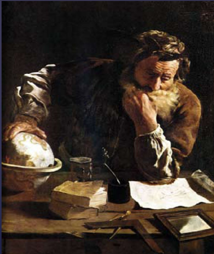
Д. Фетти. Архимед

Главной темой искусства во все времена был ЧЕЛОВЕК .