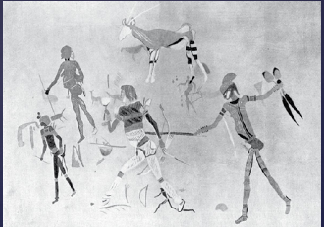
Наскальная живопись бушменов