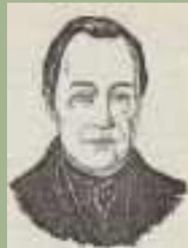
Конт Огюст (1798-1857)