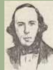
Спенсер Герберт (1820-1903)

НЕОПОЗИТИВИЗМ — совокупность философских течений, сложившихся в общем русле позитивистской традиции в 20—60-х годах XX в. и составивших содержание третьего этапа его развития.