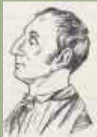
Сен-Симон Анри Де Рувруа (1760-1825)