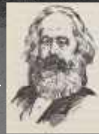
Маркс Карл Генрих (1818-1883)

МАРКСИЗМ — совокупность философских, экономических и социально-политических концепций, разработанных К. Марксом и Ф. Энгельсом и объединенных общей идеей коммунизма.