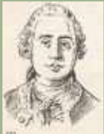
Юм Давид (1711-1776)

ПОЗИТИВИЗМ (лат. positivus — положительный) — философское направление, отрицающее познавательную и практическую ценность традиционной философии и признающее единственным источником подлинного « позитивного. » знания только специальные науки, опирающиеся на эмпирический опыт. Его предшественниками считают Д. Юма, Ж- Даламбера и К. Сен-Симона, О. Конт и Дж. С. Милль и Г. Спенсер.