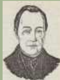
Конт Огюст (1798-1857)