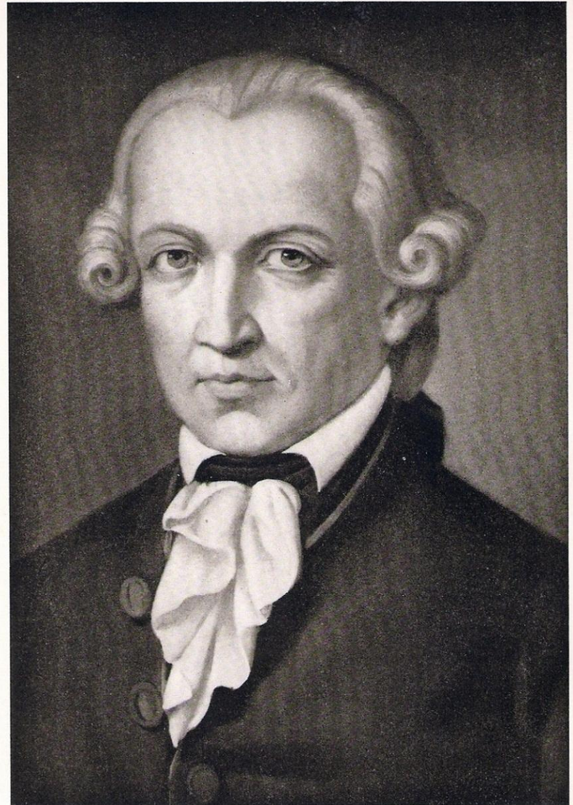
IMMANUEL KANT From a painting

"Религия в пределах только разума" (1793).