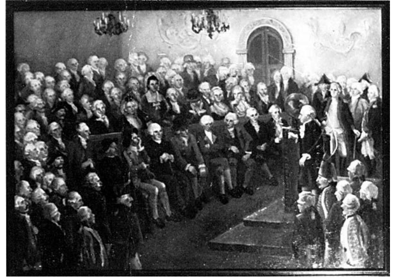
Иммануил Кант на лекции для русских офицеров

□ Критический (с 1770 г.) период получил такое название отчасти из-за подчеркнуто критического отношения к предшествующей философии, но главным образом из-за того, что изложил основные идеи своей философии в книгах, названия которых начинаются со слова «Критика...» . В этот период он защитил докторскую диссертацию «О форме и принципах чувственного воспринимаемого и умопостигаемого мира»