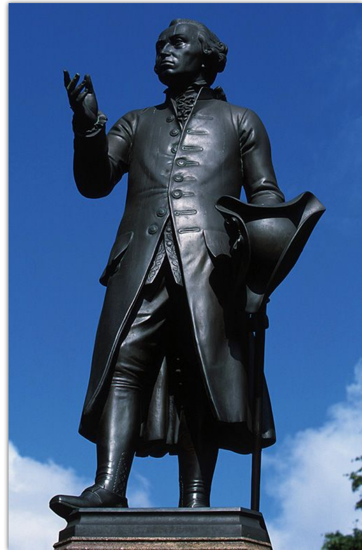
Памятник Иммануилу Канту (г. Калининград)

Заслуга Канта состоит в том, что он отделил вопросы о существовании бога, души, свободы – вопросы теоретического разума – от вопроса практического разума: что мы должны делать. Он попытался доказать, что практический разум, говорящий, в чем наш долг, шире разума теоретического и независим от него. Кант подтвердил познаваемость природы, обосновал и попытался реализовать идею новой метафизики, имеющей в качестве основания морального поведения, закон свободы.