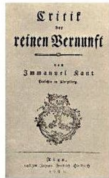
Иммануил Кант «Критика чистого разума»