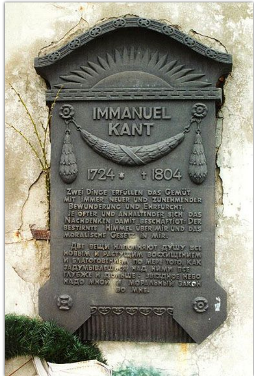
Мемориальная доска в г. Калининград

«Звездное небо надо мной и моральный закон во мне» - два основных направления философии Канта.