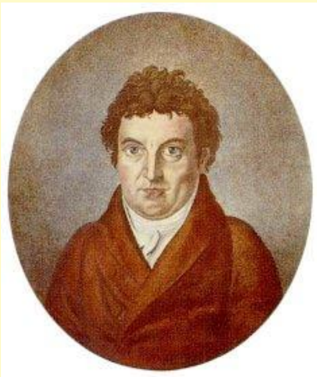
Иоганн Готтлиб Фихте 1762-1814гг

«Опыт критики всяческого откровения» трактат 1793 г