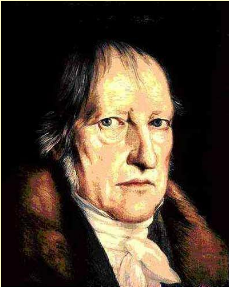
Георг Вильгельм Фридрих Гегель 1770-1831 гг