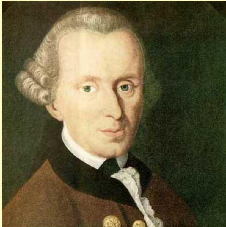
Иммануил Кант (1724 — 1804).