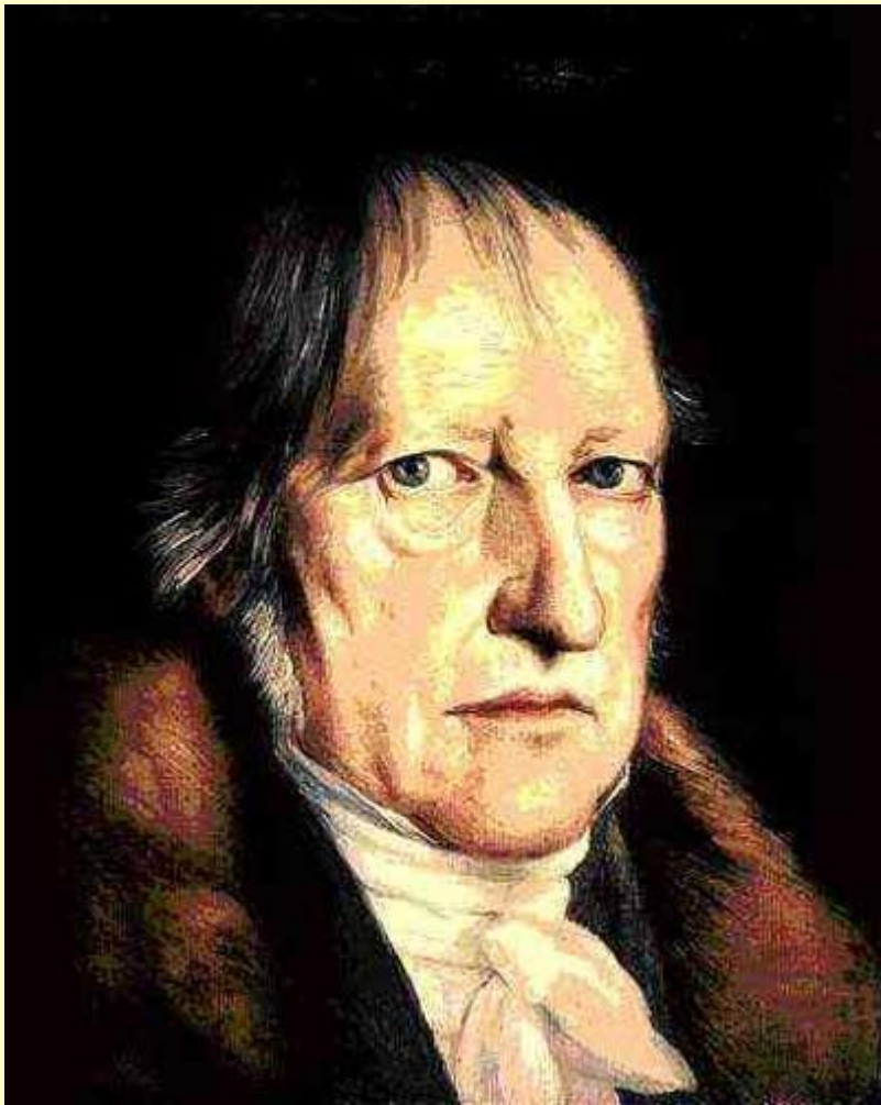
Георг Вильгельм Фридрих Гегель 1770-1831 гг