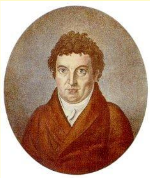
Иоганн Готтлиб Фихте 1762-1814гг

«Опыт критики всяческого откровения» трактат 1793 г