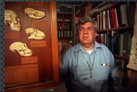
Стивен Джей Гулд

По мнению этих ученых, адапционистская программа не рассматривает альтернативы адаптивным сценариям, и не способна различать непосредственную полезность и причины ее возникновения (на примере самца тираннозавра, который мог использовать свои миниатюрные передние лапы для щекотания самок, но это не объясняет, почему его передние лапы стали такими маленькими).