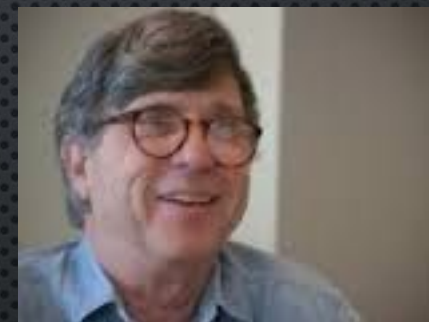
Ричард Чарлз Левонтин