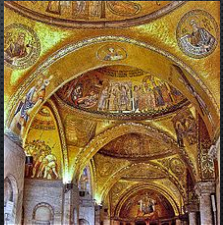
Пазухи свода собора Сан-Марко