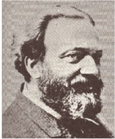
Рихард Авенариус (19.11.1843- 18.08.1896) Швейцарский философ, основоположник эмпириокритицизма