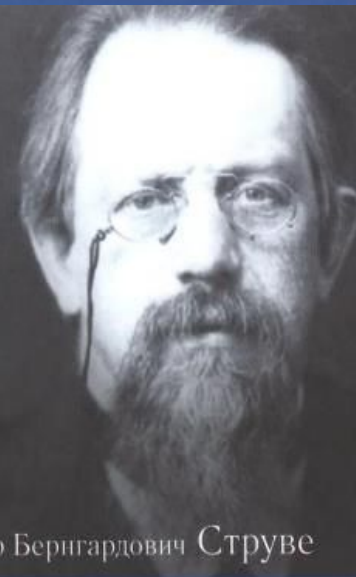
Петр Бернгардович Струве