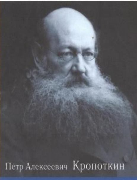
Петр Алексеевич Кропоткин