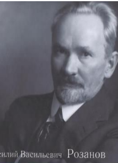
Василий Васильевич Розанов