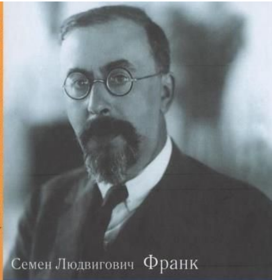
Семен Людвигович Франк