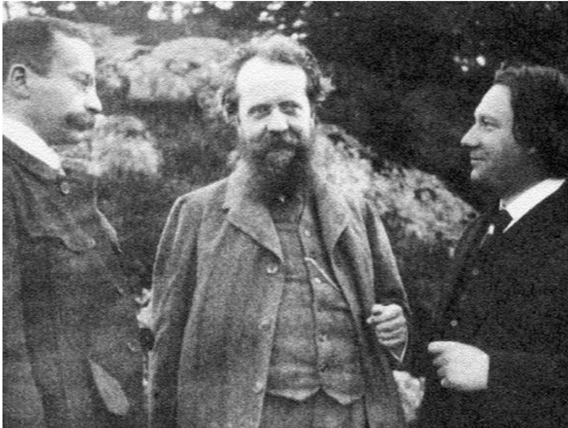
На фото: Эмиль Ласк, Генрих Риккерт, Федор Степун. Гейдельберг, 1912 г

До революции разрыва между европейской и российской философией не было. Это единственная область, где мы всегда шли в ногу с миром, а где-то его опережали.