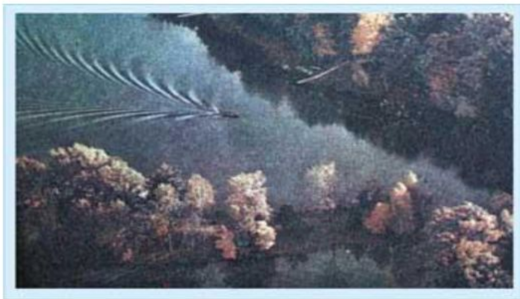
Вот как порой проявляется простота. (Уильям Гэрнетт) [П.Эткинс, Порядок и беспорядок в природе, 1987, стр. 199].

Первым сформулированным принципом теории самоорганизации является принцип древнекитайской философии «ли» - принцип естественного порядка.