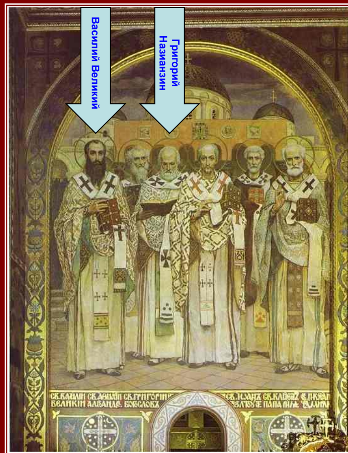
В. Васнецов. Православные епископы.