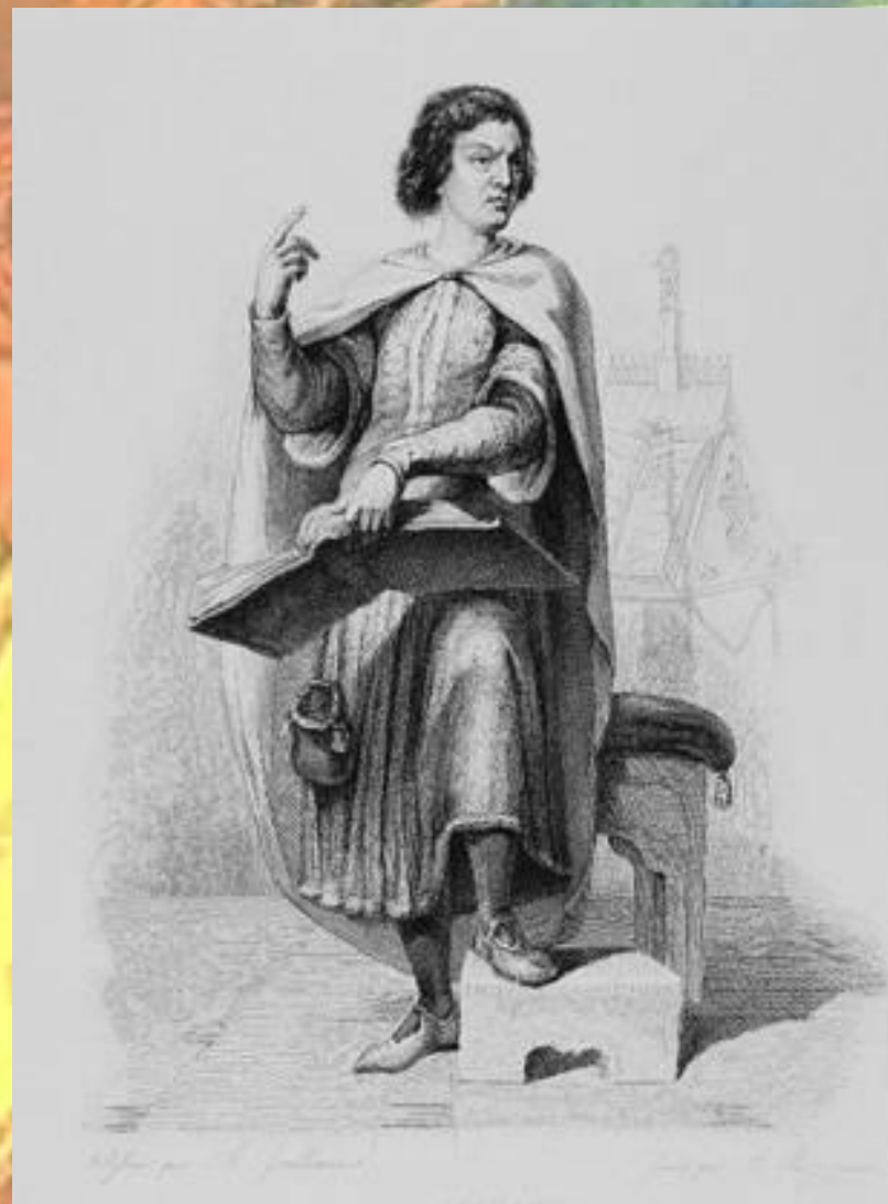
Петр Абеляр (1079-1142)