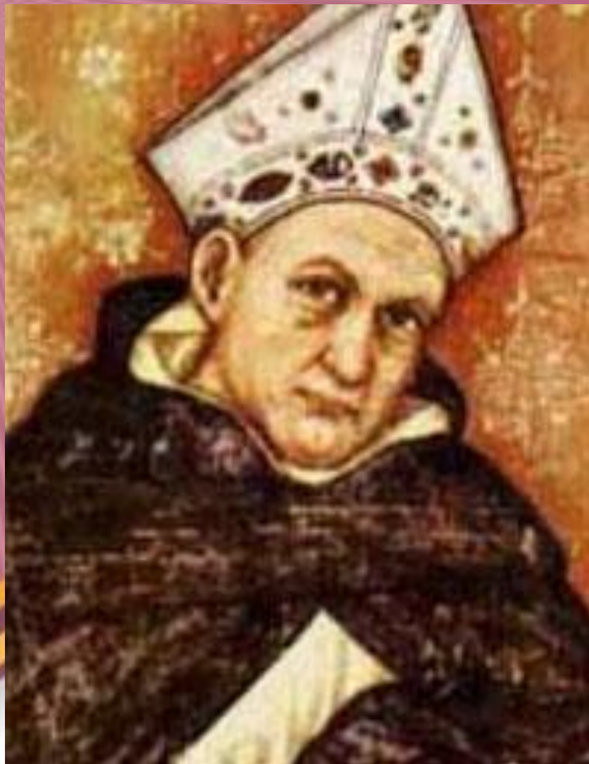
Альберт Великий (1206-1280)