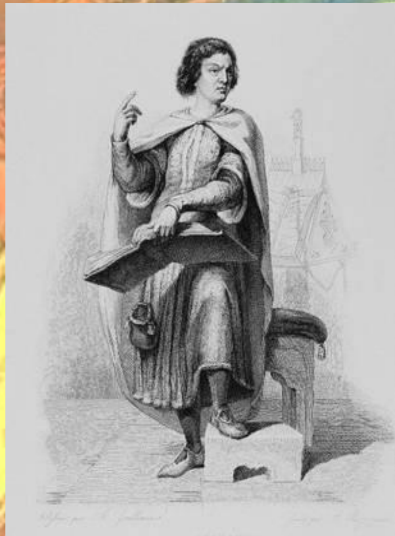
Петр Абеляр (1079-1142)