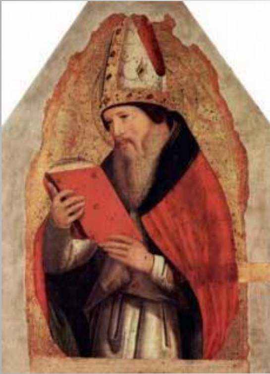
Августин Блаженный (354-430)