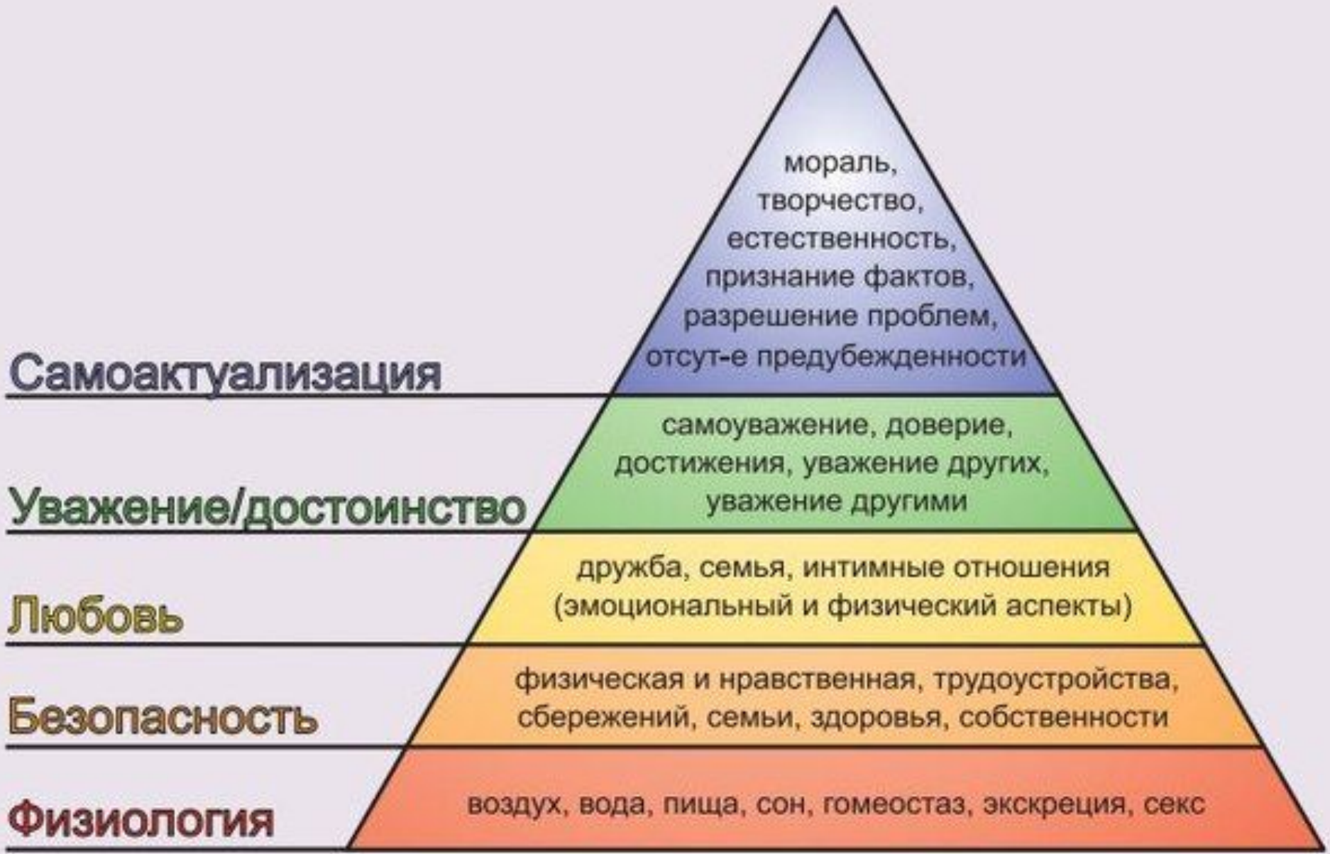
Концепция А. Маслоу иерархии потребностей в мотивации человека