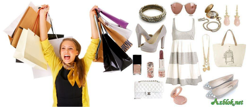
Красивая одежда и ювелирные украшения